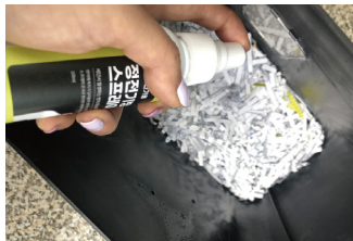
정전기방지 스프레이 100ml