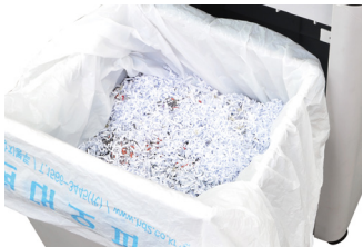
규격: 소형 | 크기: 650X550mm